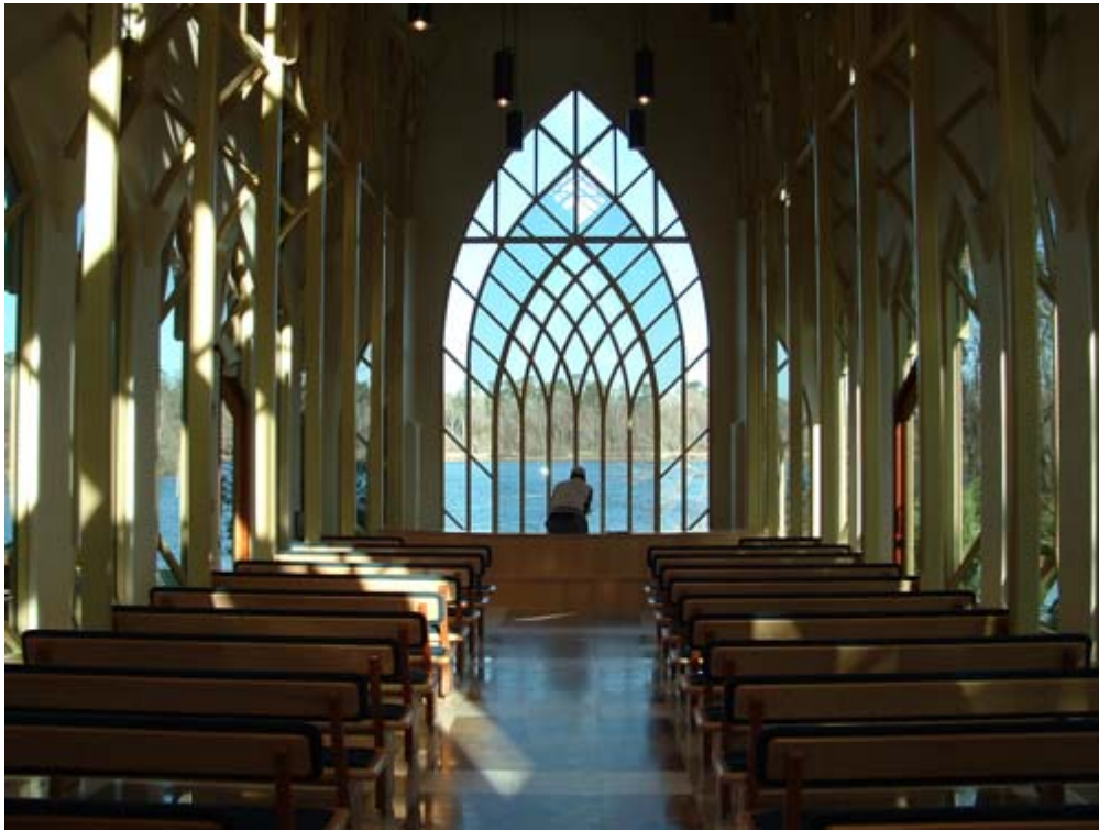
مرکز «باگمن» در دانشگاه فلوریدای آمریکا