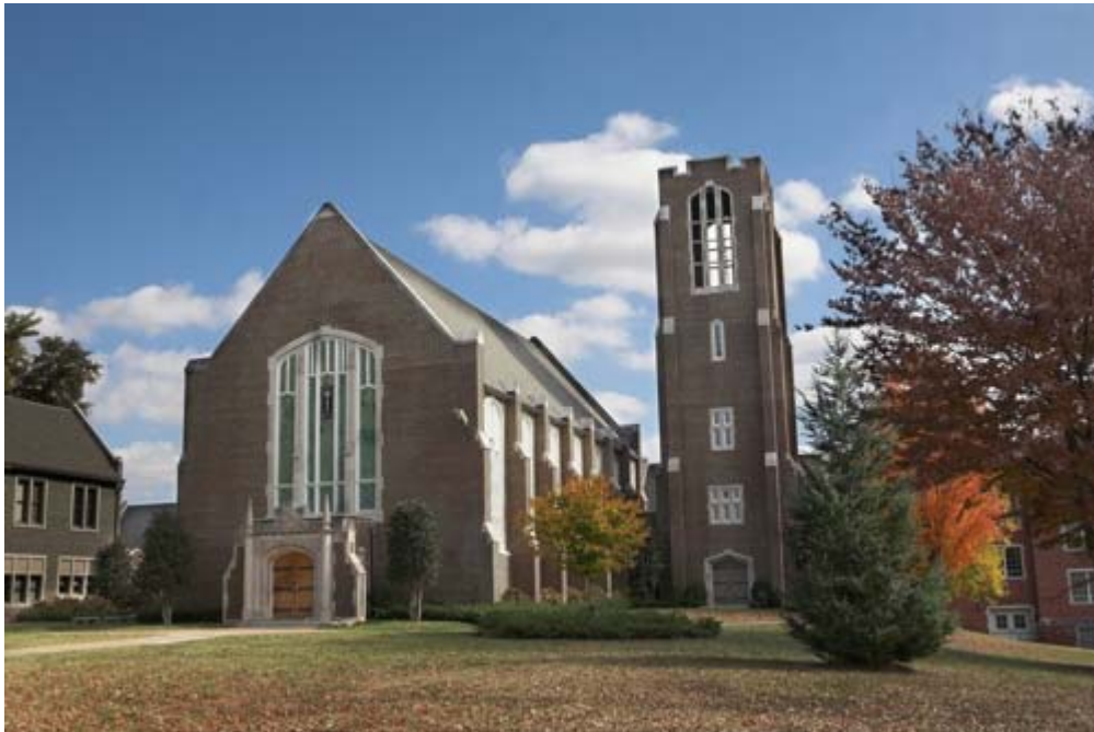
کلیسای پتن در دانشگاه تنسی چاتانوگا - آمریکا